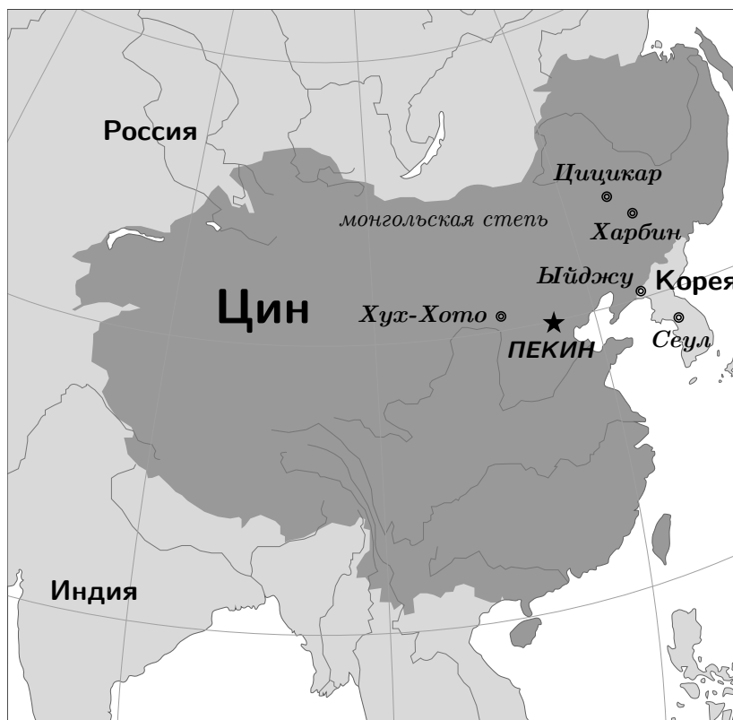
Карта династии Цин (ок. 1760 г.)

△ Маньчжурский язык относится к тунгусо-маньчжурской семье. На нём говорили маньчжурские племена в историческом регионе Маньчжурия в северо-восточной Азии. Он был одним из официальных языков династии Цин, основанной маньчжурами. С течением времени маньчжурский язык был вытеснен китайским, так что на сегодня насчитывается всего несколько десятков его носителей.