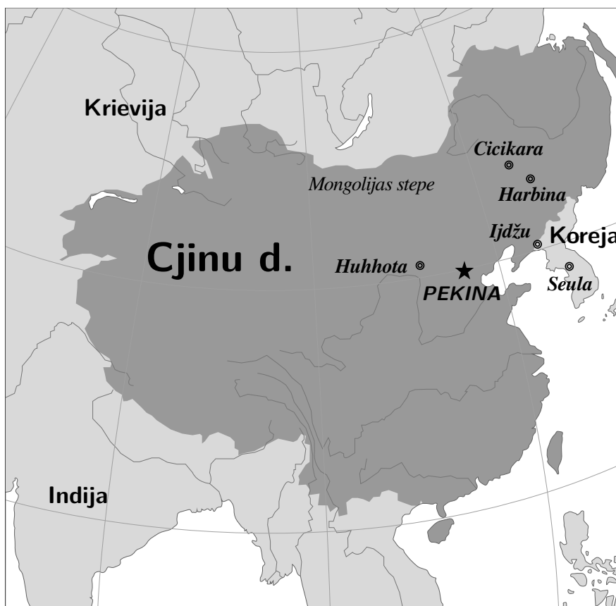
Cjinu d. dinastijas karte (ap 1760. g.)

△ Mandžūru valoda pieder tungusu valodu saimei. Tajā runāja mandžūru ciltis Mandžūrijas vēsturiskajā apgabalā Ziemeļaustrumāzijā. Tā bija viena no mandžūru dibinātās Cjinu d. dinastijas oficiālajām valodām. Ar laiku mandžūru valodu pakāpeniski aizvietoja ķīniešu valoda, tāpēc mūsdienās dzīvi ir vien daži desmiti mandžūru valodā runājošie.